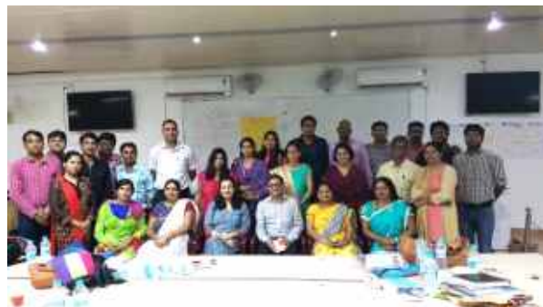
उत्तर प्रदेश राज्य में आयोजित 2017 बैच की दूसरी कार्यशाला