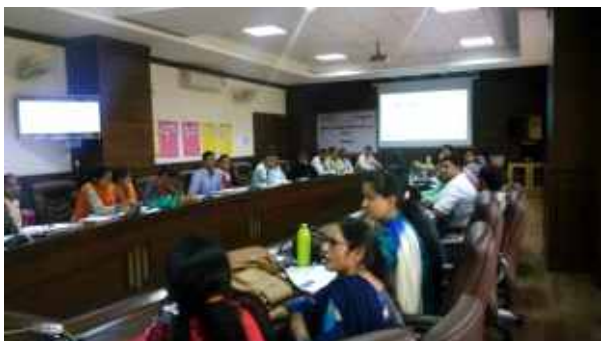
हरियाणा राज्य में आयोजित 2017 बैच की दूसरी कार्यशाला

प्रारंभिक भाषा शिक्षण का यह दूरस्थ शिक्षा का कोर्स अपनी तरह का एक अनूठा कोर्स है जो प्रारंभिक भाषा एवं साक्षरता के क्षेत्र में अध्यापकों तथा शिक्षक-प्रशिक्षकों के व्यवसायिक विकास के लिए शुरु किया गया है। यह कोर्स ऐसे अध्यापकों और शिक्षक-प्रशिक्षकों के लिए चलाया जा रहा है जो प्रारंभिक कक्षाओं, खास तौर से कक्षा 1-3 में हिंदी भाषा पढ़ाते हैं।