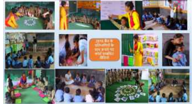
2016 बैच के प्रतिभागियों के साथ बनाये गए कोर्स सम्बंधित वीडियो