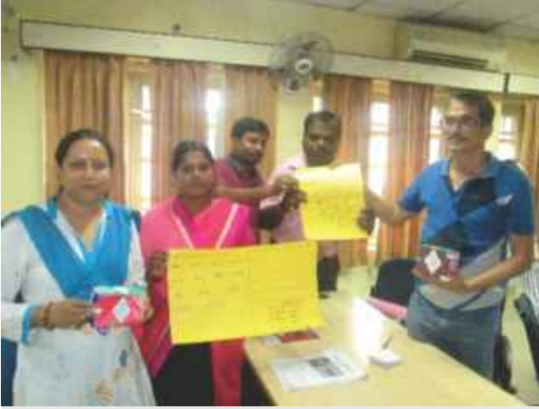
बिहार राज्य की कार्यशाला में डिक्टोडिंग की गतिविधि का प्रदर्शन करते प्रतिभागीयों का एक समूह।