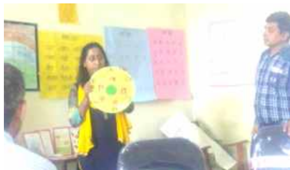
राजस्थान राज्य में आयोजित कार्यशाला के दौरान टी.एल.एम का प्रयोग करते हुए एक प्रतिभागी