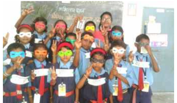
2017 बैच के प्रतिभागी द्वारा कक्षा में करायी गयी रोल प्ले की गतिविधि