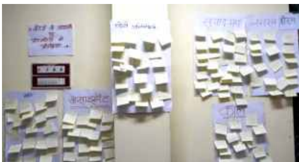
कोर्स के विभिन्न घटकों पर छत्तीसगढ़ राज्य के प्रतिभागियों का फीडबैक